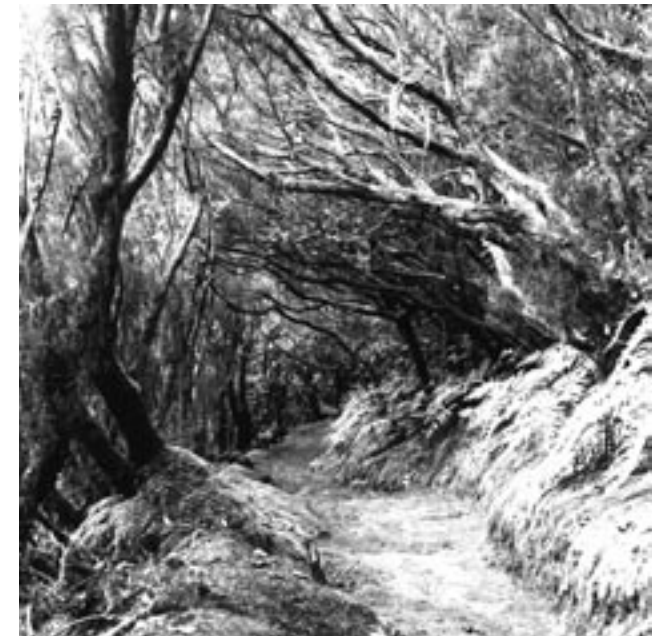
„Herausgekommen sind diesmal Impressionen eines Schwebezustandes, die ein Gefühl von grenzenloser Freiheit vermitteln {...]. Zusammen mit den neun Kurzgeschichten entsteht eine atmosphärische Mischung aus Poesie, Erotik, Sehnsucht und Fantasie, die unmittelbar berührt.“ Hildesheimer Allgemeine Zeitung