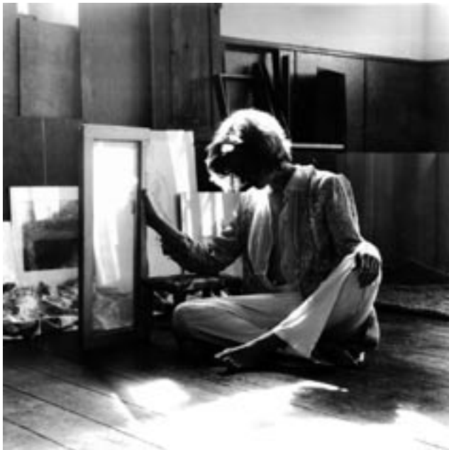
„„Modell Gehen‘ ist kein Fotobuch im üblichen Sinne. Vielmehr werden hier in sehr mutiger Weise den Betrachtern/Lesern Projekte gezeigt, die einer Art Selbstfindung dienen [...], Ein in seiner Offenheit sehr ungewöhnliches Buch, das sich von dem üblichen Angebot abhebt und im Gedächtnis bleibt.“ PHOTONEWS